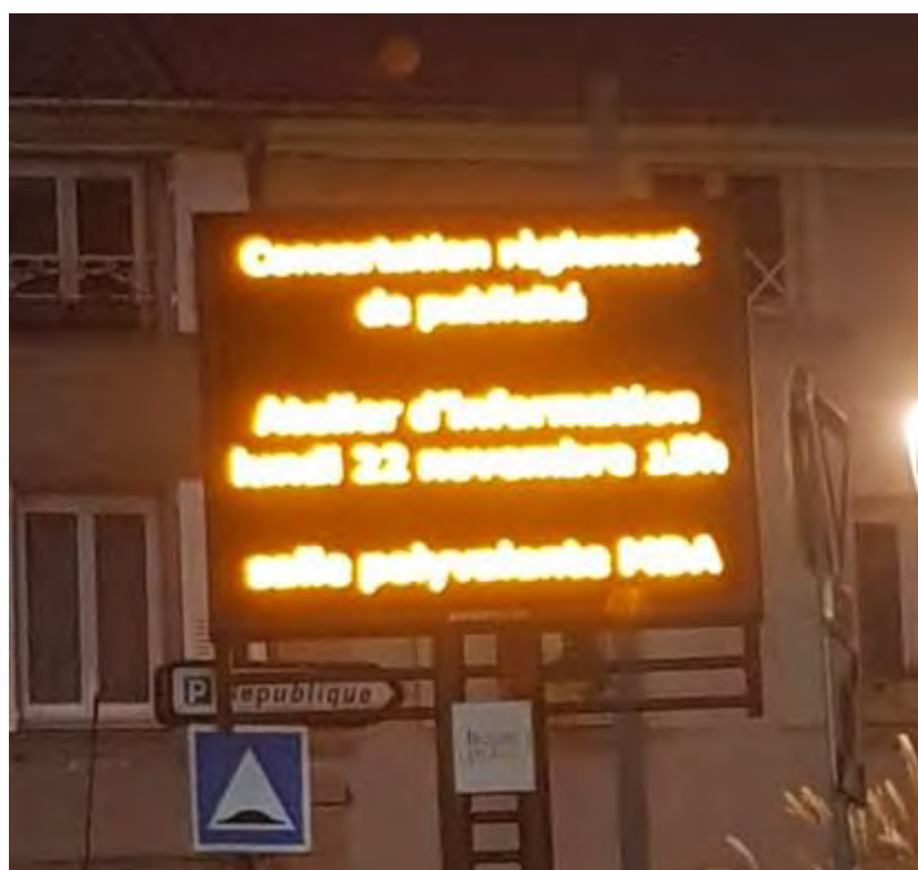
Exemple affichage sur journal numérique de la ville